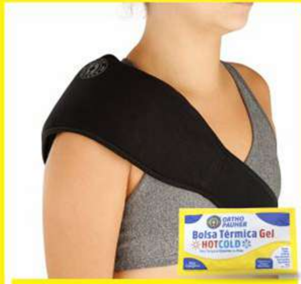
Faixa Multi-Usos de Neoprene com ou Sem Bolsa Térmica Ref.: AC074 S/BOLSA AC075 C/BOLSA