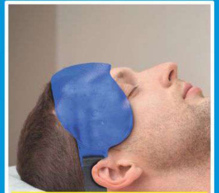
Bolsa Gel para Testa Hot/Cold Ref.: AC086