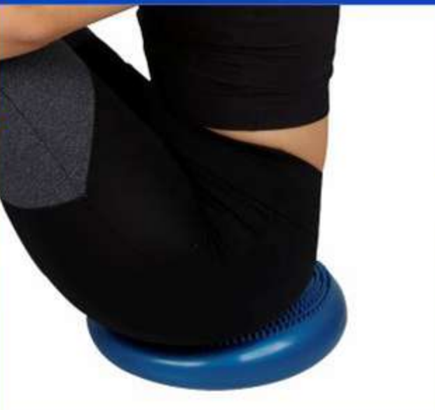
Disco de Equilíbrio Fisiopauher Ref.: FG22 Tam.: Único