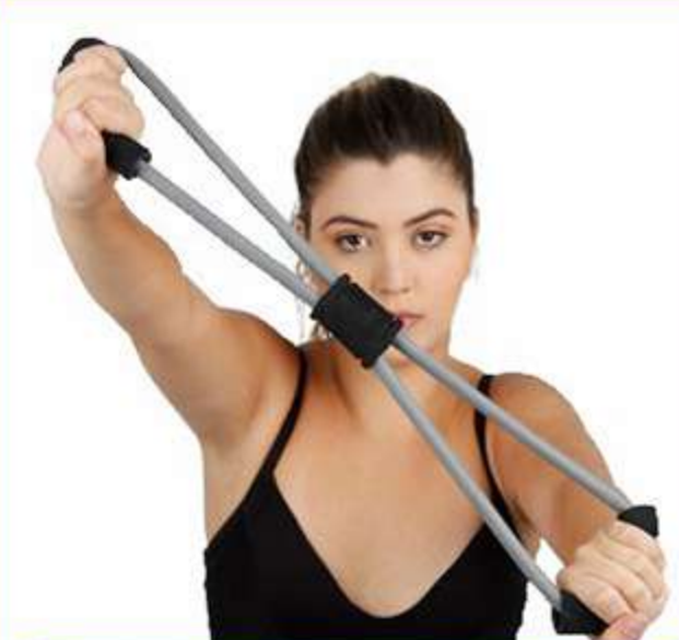
Extensor Flexível Fisiopauher Ref.: FG26 Tam.: Único