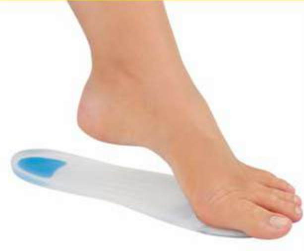
Palmilha SobGel com Ponto Azul Ref.: 13001