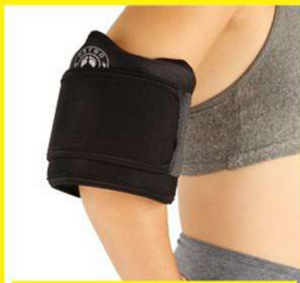
Cotoveleira Universal de Neoprene Ajustável Ref.: AC487