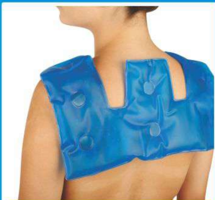
Bolsa Térmica para Ombros Hot/Cold Ref.: AC065