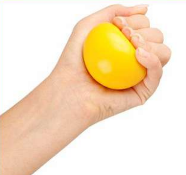
Esfera para Fisioterapia e Fortalecimento Ref.: SK11 Tam.: Único