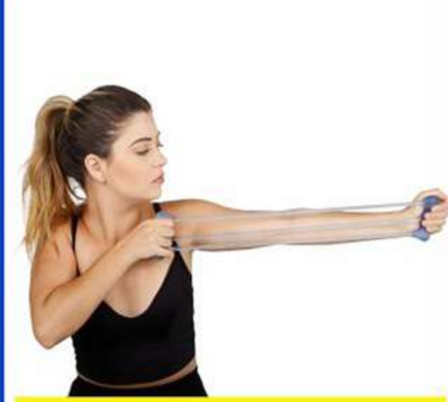
TuboGel Triplo Fisiopauher Ref.: FG24 Tam.: Único