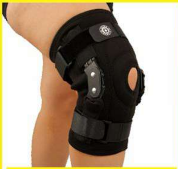
Joelheira de Neoprene Articulada Policêntrica com Cintas Ajust. Ref.: AC315