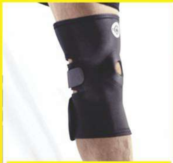
Joelheira c/ Reforço Patelar Ajustável Ref.: AC516