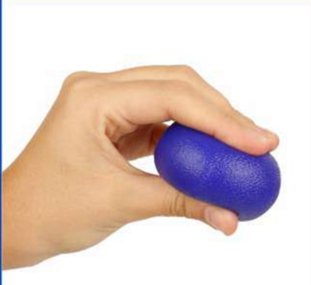
Esfera Multiresistência Ref.: FG25 Tam.: Único 5 níveis de resistência