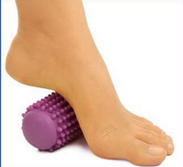
Tubo Fisioterápico Ref.: FG03 Tam.: Único