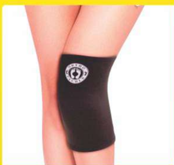
Joelheira Curta Ref.: AC523