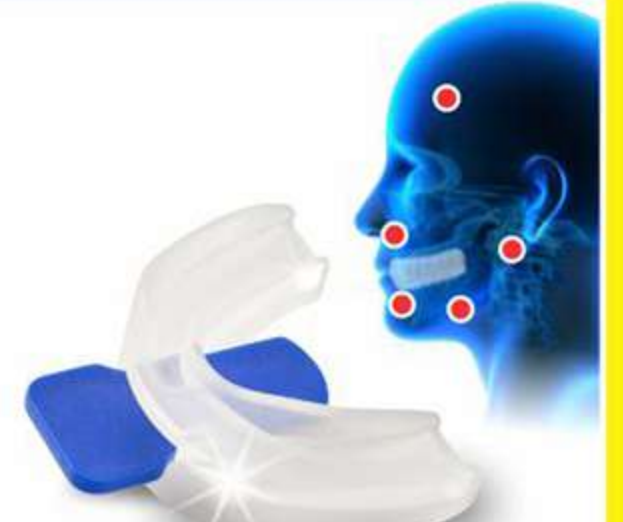
Protetor Bucal Duplo Moldável Ref.: 4062