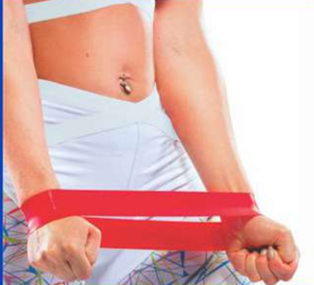
Faixa Elástica Mini Band Ref.: FG34