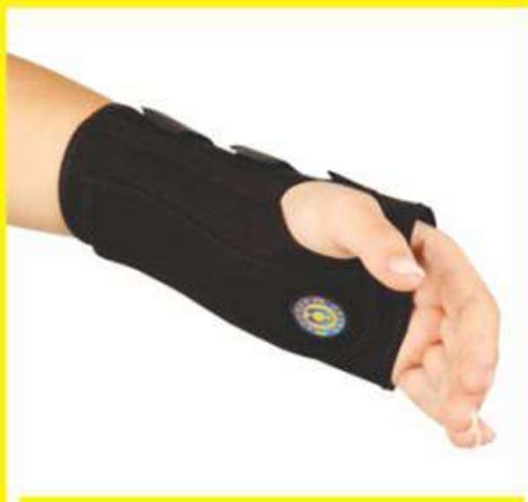
Munhequeira de Neoprene Noturna Bilateral Ref.: AC495