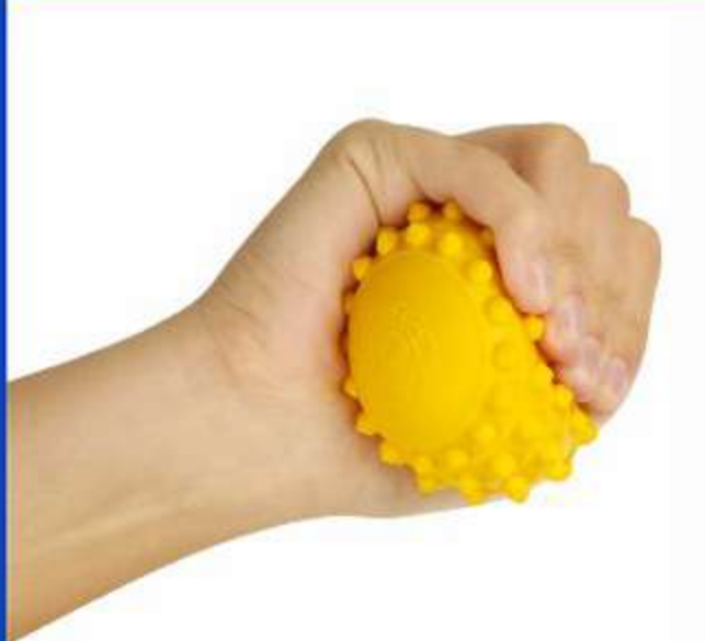
Esferas Fisioterápicas Ref.: FG12/15 Tam.: 5,5/6,5cm