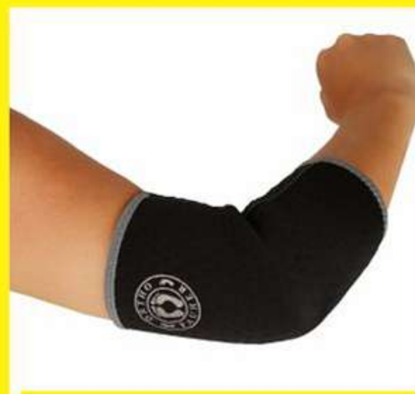
Cotoveleira Longa Ref.: AC436