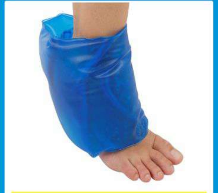
Bolsa Gel para Tornozelo Ref.: AC088