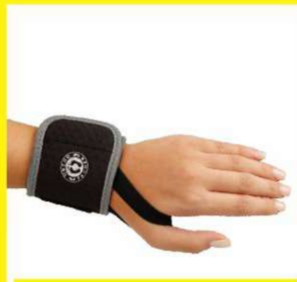
Munhequeira com Tira no Polegar Ref.: AC461