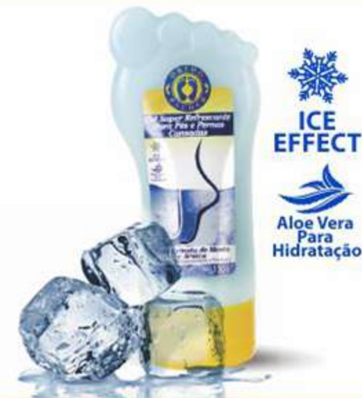
Gel Super Refrescante p/ Pés e Pernas Cansadas Ref.: CM101