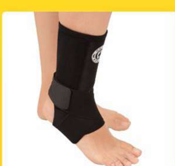
Estabilizador de Neoprene Para Tornozelo Ref.: AC530