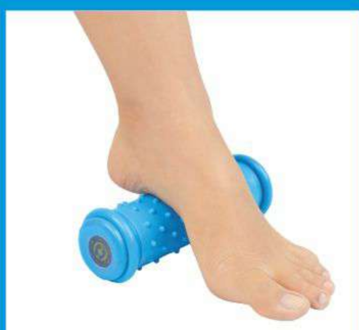
Rolo Hot/Cold para Fisioterapia e Massagem Ref.: AC078 Tam.: Único