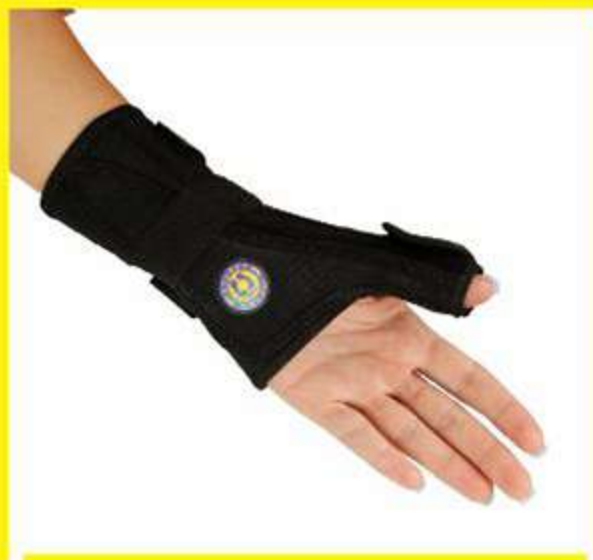
Tala Ajustável de Neoprene para Punho e Polegar Ref.: AC497