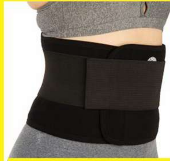
Cinta de Neoprene Lombar com Hastas Flexíveis Ref.: AC533