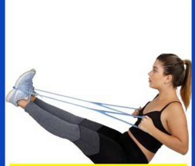
Tubo Gel Extensor Fisiopauher Ref.: FG29 Tam.: Único