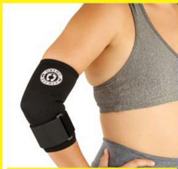
Cotoveleira de Neoprene com Ajust. Tênis Elbow Ref.: AC488