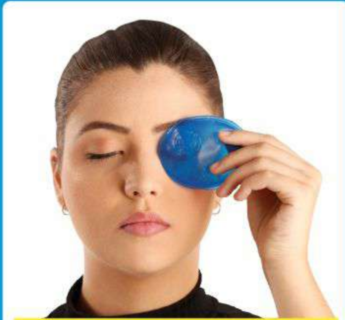
Bolsa Térmica Gel para os Olhos Ref.: AC064

Recuperação, Dores, Contusões, Febre, Cólicas, Hematomas, Torcicolos e Relaxamento.