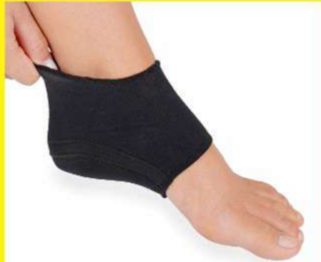
Calcanheira Pauher Support Ref.: 1021 Tam.: P-M-G