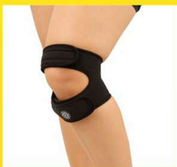
Joelheira de Neoprene Sub Patelar Ref.: AC512