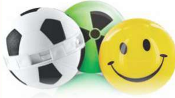
Esferas Ultra Perfumadas Multi-Usa Ref.:CM500