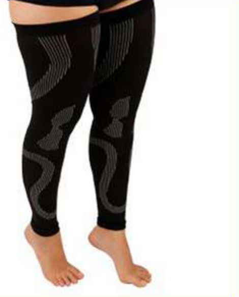
Meia Compressiva Esportiva Ref.: COP127 Tam.: P-M-G-GG

Produtos para saúde e bem-estar, com o objetivo de aumentar a performance e proporcionar mais conforto.