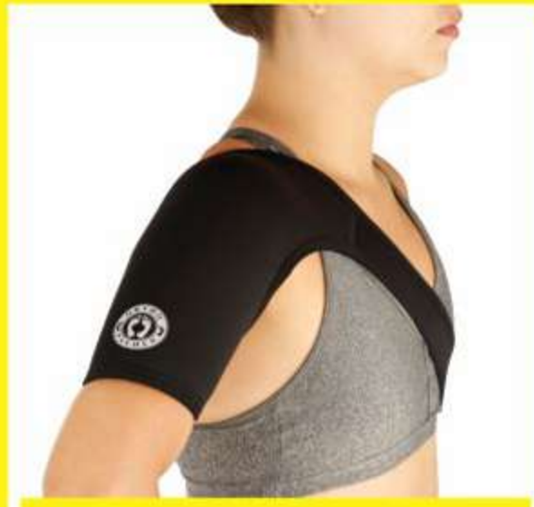
Suporte de Neoprene para Ombros Ref.: AC532