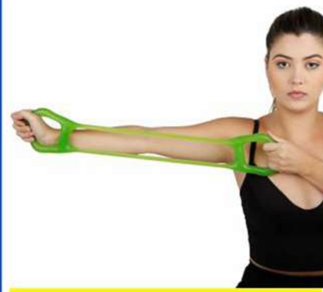
Tubo Gel Extensor Duplo Ref.: FG28 Tam.: Único