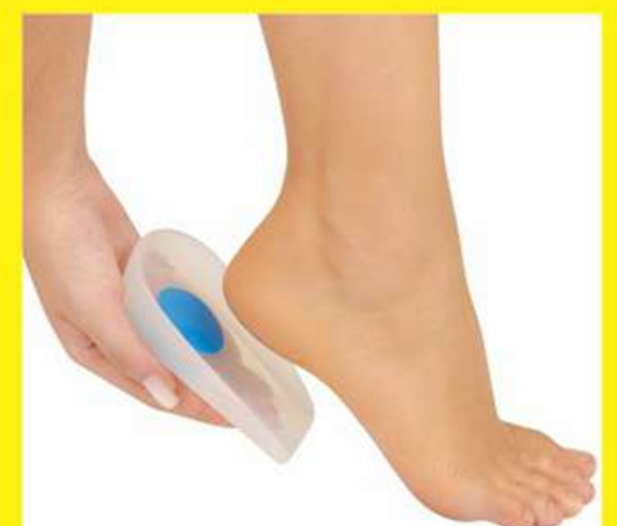
Calcanheira Siligel Ref.: 1002 Tam.: P-M-G