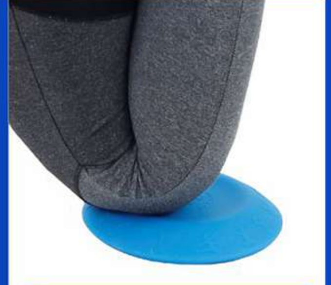
Almofada de Silicone Yoga Pad Ref.: FG41 Tam.: Único