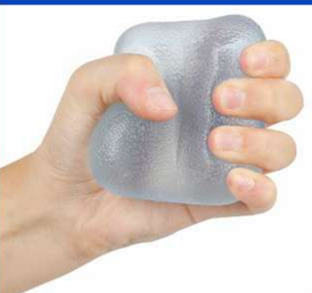
HandGel Fisiopauher Ref.: FG19 Tam.: Único