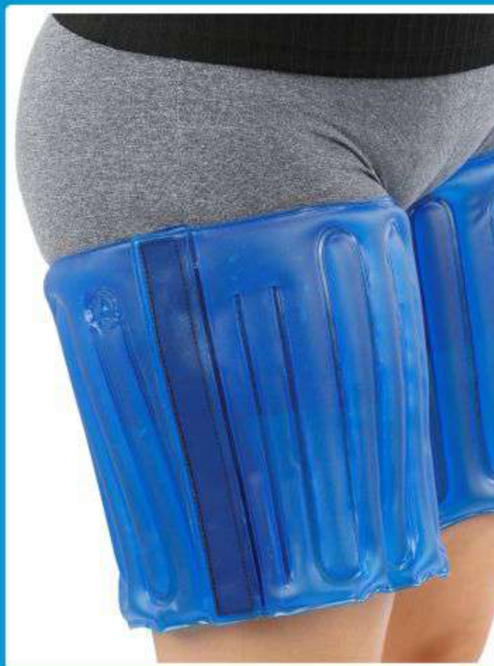
Faixa Gel para Quadril/Coxa Ref.: AC096