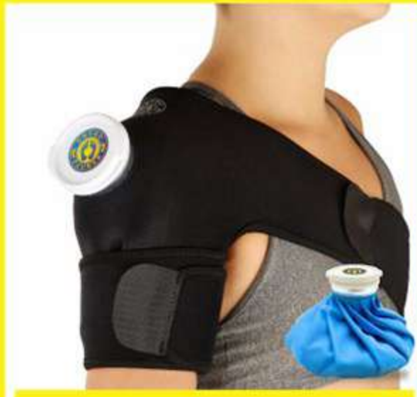
Suporte de Neoprene Sem ou Com Bolsa para Gelo Ref.: AC071/AC072

Para tratamento e prevenção de patologias de cabeça, tronco e membros.