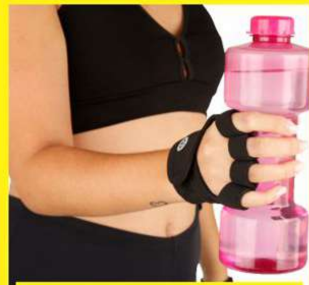
Luva Women Action Ref.: AC482