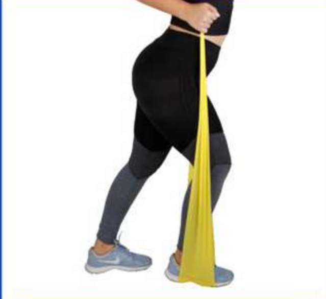
Faixa Elástica Thera-Pauher Ref.: FG27 Tam.: Único