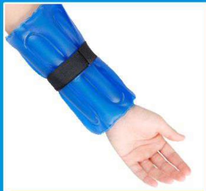
Bolsa Gel Para Punho Hot/Cold Ref.: AC087