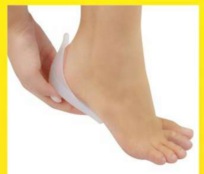
Calcanheira Vertical com Ponto Azul Ref.: 2900 Tam.: M-G