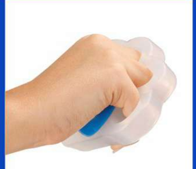
FisioHand Siligel para Fisioterapia Ref.: 4020/21 Tam.: Único