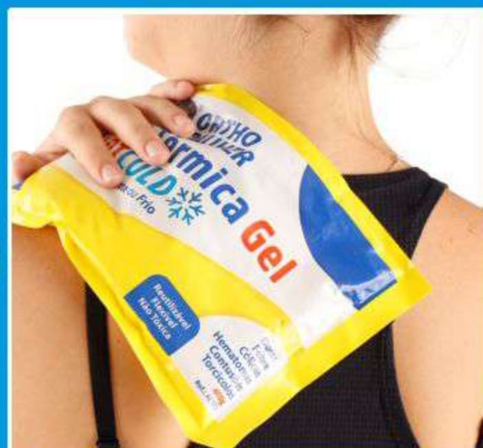
Bolsa Térmica Gel Hot/Cold 200/400g Ref.: 200g/400g