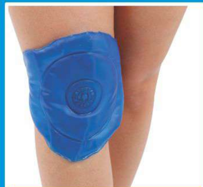
Faixa Gel para Joelho/Cotovelo Ref.: AC095