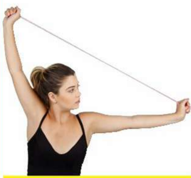
Tubogel Fisiopauher Ref.: FG23 Tam.: Único 5 níveis de resistência

Treinamentos Esportivos, Fitness, Condicionamento, Reabilitação de Lesões, Movimentos e Fortalecimento.