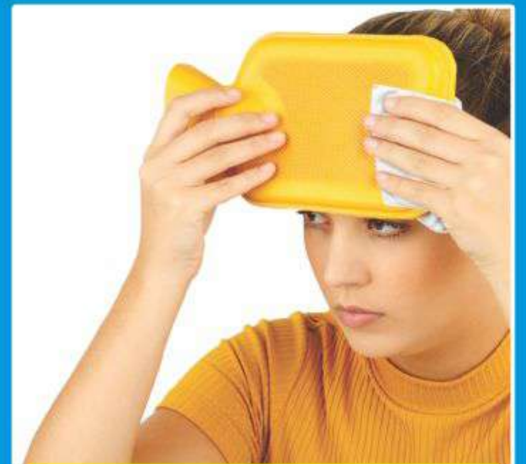
Bolsa para Água Quente Ref.: BT01 Tam.: P-M-G