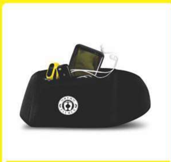
Pochete Anatômica Action Ref.: AC485