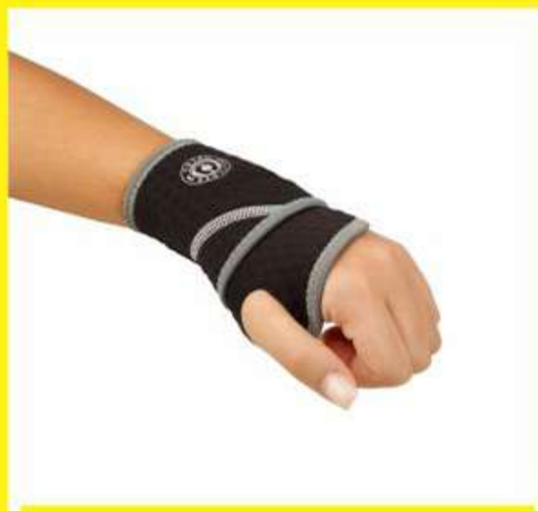
Munhequeira de Neoprene Ref.: AC469