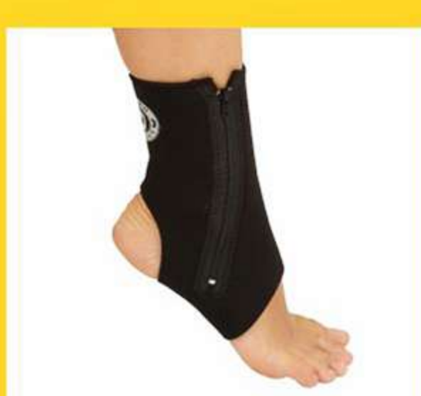
Tornozeleira de Neoprene com Zíper Ref.: AC529