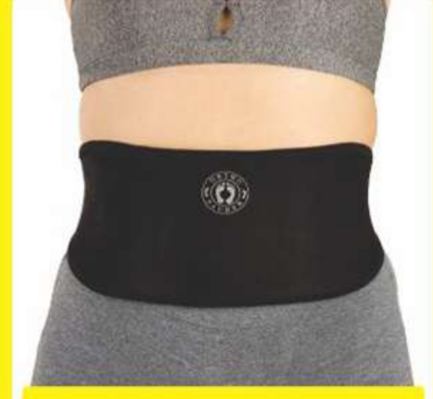
Faixa de Neoprene Ref.: AC626