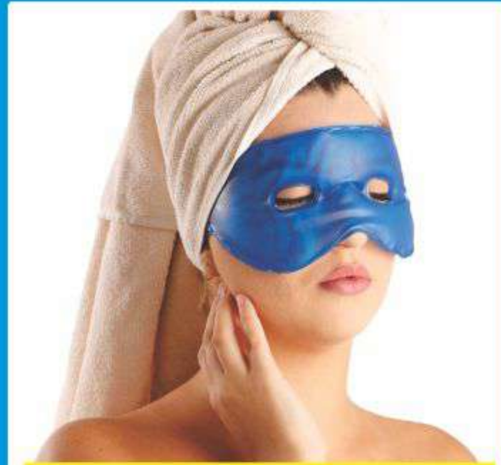
Máscara Gel Hot/Cold Ref.: AC067