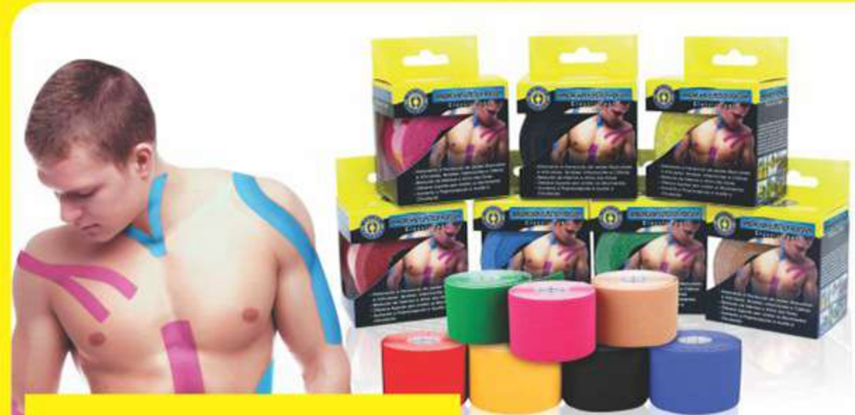
Bandagem Elástica Adesiva Ortopédica Ref.: KP101

Turbine seu Tênis com o mais potente Amortecedor