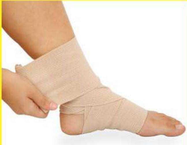
Atadura Elástica de Compressão Ref.: AC2031