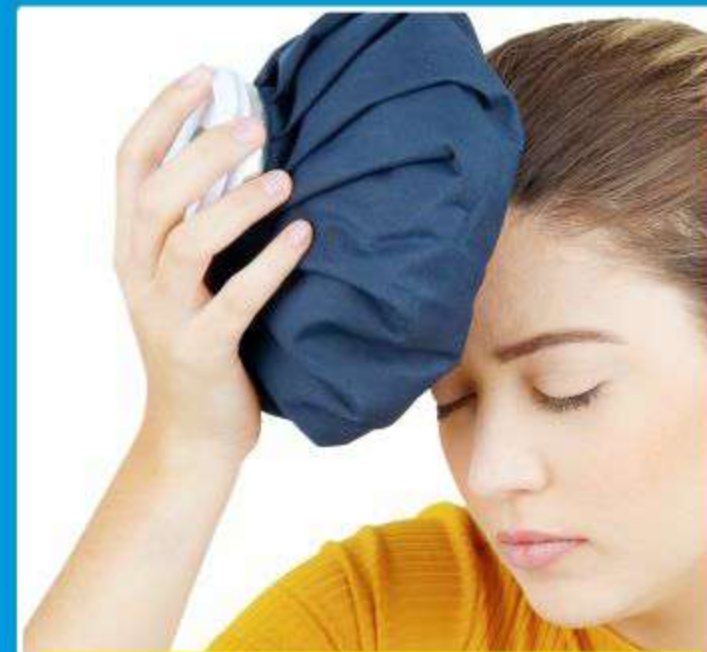
Bolsa de Gelo Ref.: AC070 Tam.: P-M-G