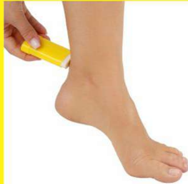
Bastão Anti Atrito Ref.: MF50/51