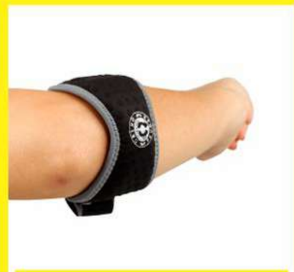
Cinta Tênis Elbow de Neoprene Ref.: AC432