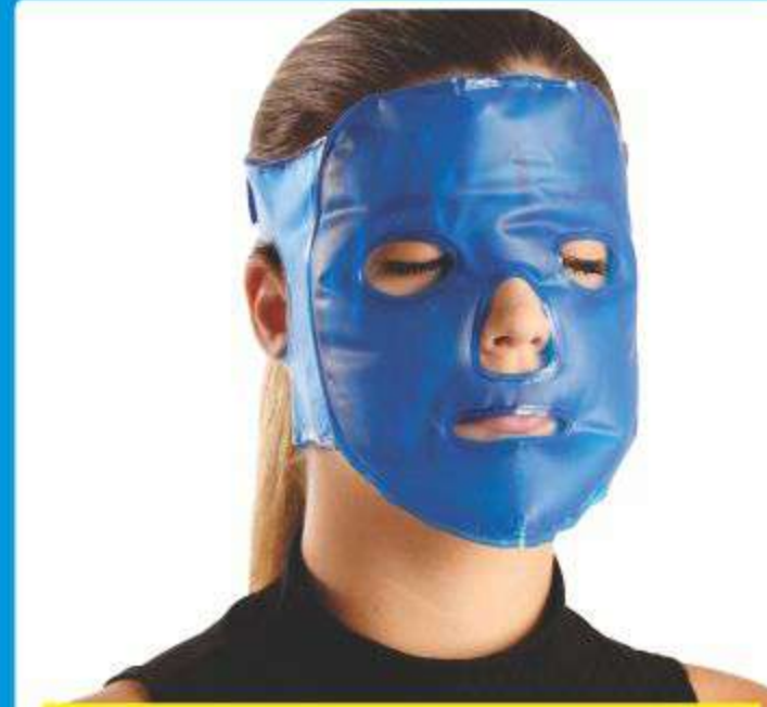
Máscara Facial Gel Hot/Cold Ref.: AC069