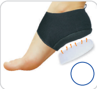
Calcanheira Pauher Support Ref.: 1021