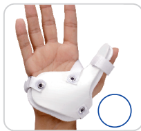
Tala de PVC para Polegar BracePauher Ref.: AC450