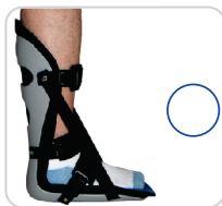
Fascite Plantar e Tendinite Ref.: AC110