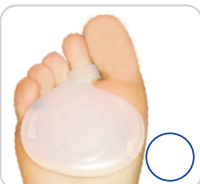
Almofada Plantar Com Anel Dois Dedos Ref.: 4006