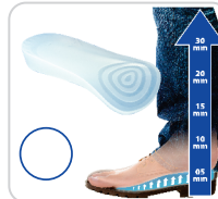
Palmita 3/4 Para Compensação Direito e Esquerdo 5, 10, 15, 20, 30mm