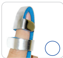
Splint Para Dedo Ref.: AC444