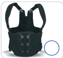
Knight Taylor Colete Dorso Lombar Ref.: AC600