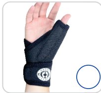
Tala Ajustável de Neoprene Para Punho e Polegar Ref.: AC497