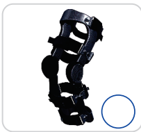
Joelheira Articulada Com Movimento Livre Ref.: AC308