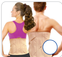
Colete Putti Elástico Baixo e Alto