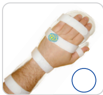
Tala de PVC Ref.: AC639