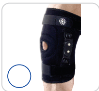
Joelheira Articulada Policêntrica com Cinta Ajustável Ref.: AC315