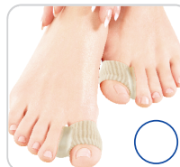
Anel Corretivo Para Joanete 2 em 1 Ref.:SG326