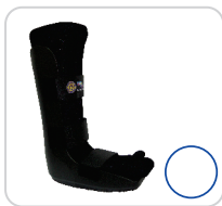
Bota Imobilizadora Ref.: AC208