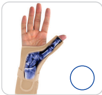
Tala Punho e Polegar Ref.: AC456