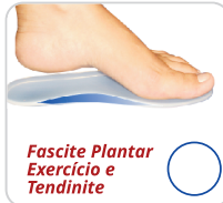
Fascite Plantar Exercício e Tendinite