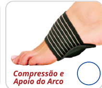
Compressão e Apoio do Anco