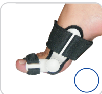
Corretivo Para Joanete Ref.: 4050 (Uso Diurno e Noturno)