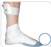
Calha AFO Flexível Ref.: AC100