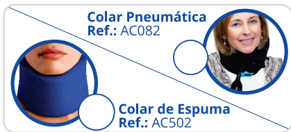
Colar Pneumática Ref.: AC082 Colar de Espuma Ref.: AC502 Colar Pneumática ou de Espuma