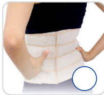
Faixa Elástica Abdominal Ref.: AC624