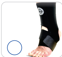
Estabilizador de Neoprene Para Tornozelo Longa Ref.: AC530