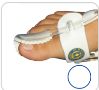
Corretivo Para Joanete Ref.: 4008 (Noturno)