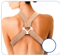
Espaldeira Simples Ref.: AC630