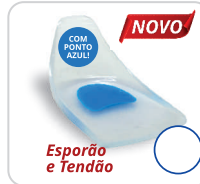
Esporão e Tendão