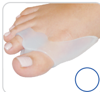
Corretivo Siligel 3 em 1 Ultra Ref.: 4030x