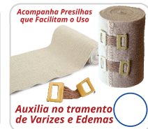
Acompanha Presilhas que Facilitam o Uso