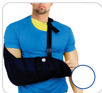
Tipóia Velveau Luxo Ref.: AC420