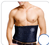
Faixa de Neoprene Ref.: AC626