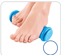
Rolo HoltCold e Fascite Plantar Massagem Para os Pés Ref.:AC078