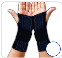
Tala Curta e Longa Punho Bilateral Ref.: AC631