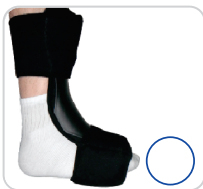
Órtese Noturna Fascite Plantar Ref.: AC108