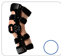
Joelheira dois Velcros com Limitador Ref.: AC305