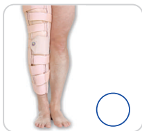
Imobilizador de Joelho Fixo Ref.: AC313