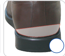
Calcanheiro Siligel Para Desvio de Calcâneo Ref.: 1019