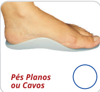
Pés Planos ou Cavos